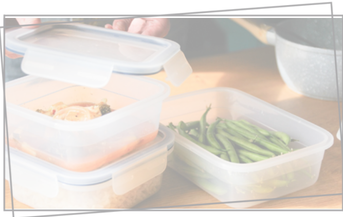
Beste restverdediging ever!